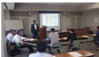
ワークショップ風景（イメージ）